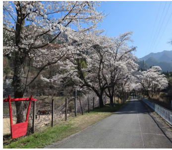
4 / 1 区民広場

4月は、寒かったり、夏日になったりと寒暖差が激しく、体調管理に苦労した月でした。