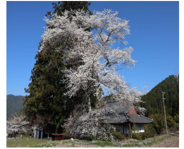
4 / 1 縣神社