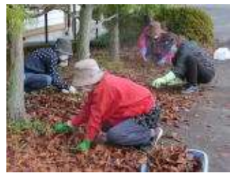
集会所周りの草取り落ち葉等清掃