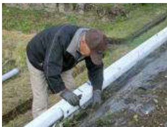
縣神社前の花壇の後片付け等

のお陰ですっかりきれいに片づけられました。また、花壇にはチューリップの植えもおこなわれました。桜和会の皆さんご苦労様でした。次回は「新入生児童のお祝い品づくり」を計画されています。「お～ わかい」パワーに圧倒された1日でした。